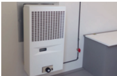
Gasheizung - Wandmontage

Auf diesem Bild ist zu sehen, dass ein Bauwagen mit einem Ofen für feste Brennstoffe ausgestattet werden kann. Dieser steht dann aber nicht an bzw. in einem Wald. Vorbildlich sind die zwei Ausgänge mit sicheren Treppen und Geländern dieses Bauwagens, die sogar die wesentlichen Anforderungen an einen Sonderbau erfüllen würden.