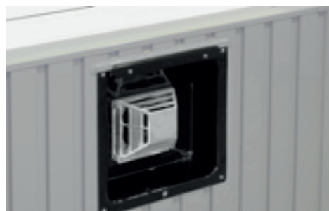
Abgasführung durch die Außenwand