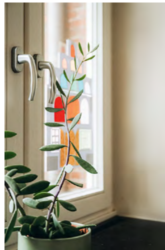
Ein ehemaliger Serverraum ist heute ein Ruheraum