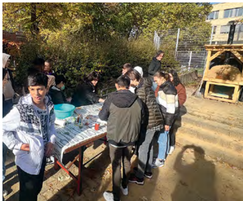
Projekte wie der selbst gebaute Pizzaofen stärken die Gemeinschaft

ren Krisengebieten der Welt hinzu. Eine bundesweite, amtliche Zahl für alle geflüchteten Schülerinnen und Schüler gibt es aber nicht.