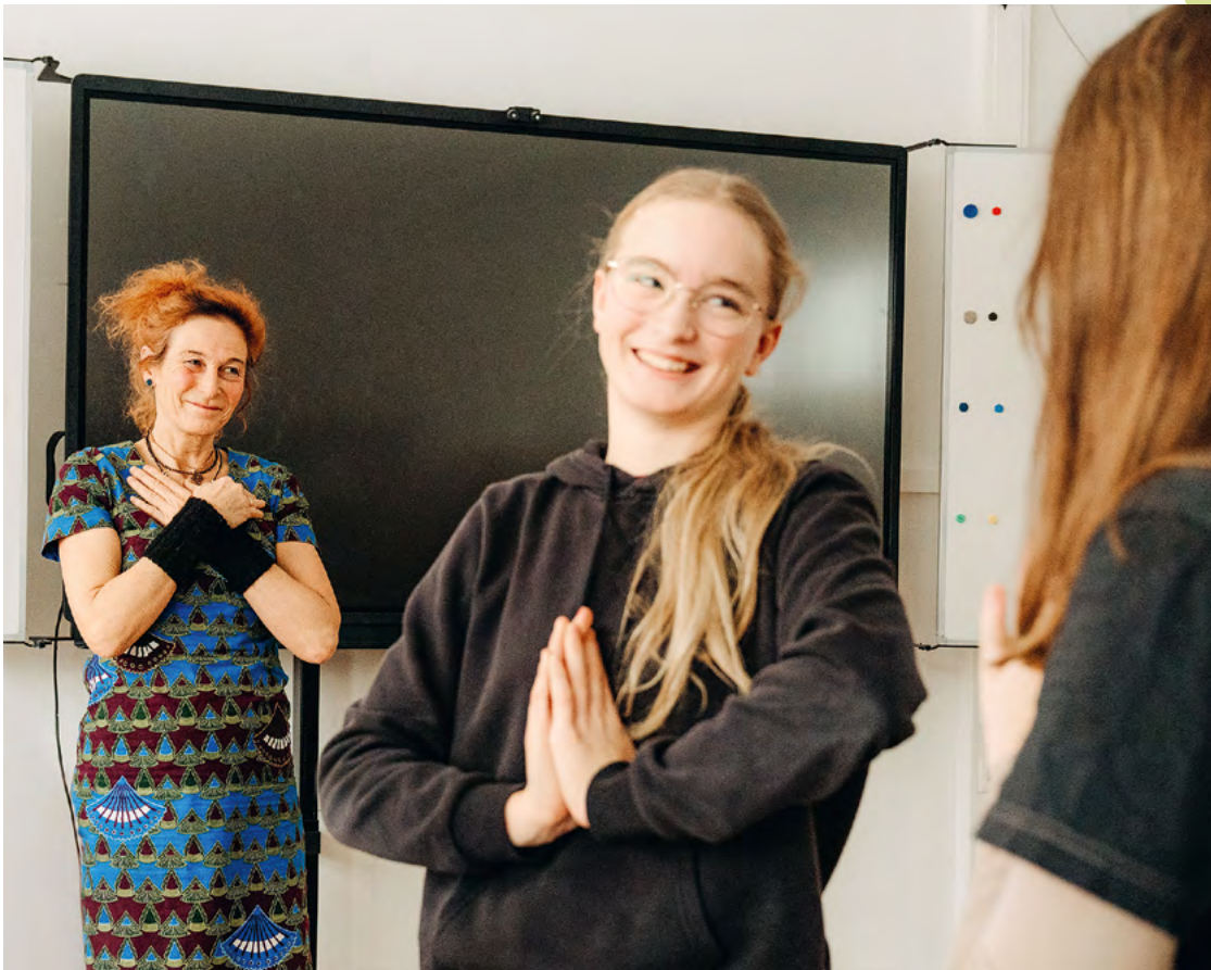
Die Übungen sorgen für bessere Konzentration